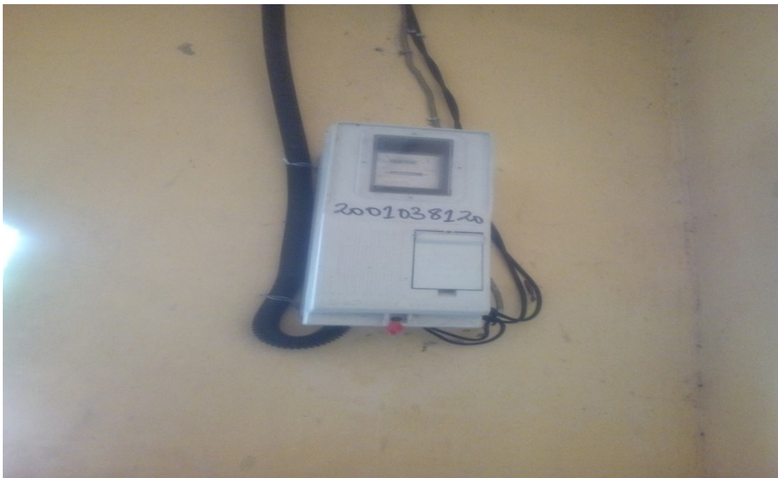
Nouveau compteur recouvert

Toutes les activités citées ci-dessus on été réalisées avec succès.